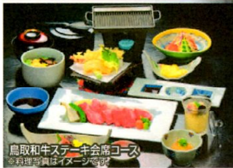
鳥取和牛ステーキ会席コース ※料理写真はイメージです