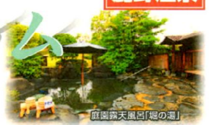
庭園露天風呂「堀の湯」

※土曜日及び12/22～1/13・2/10は除きますが、3/20は宿泊利用可能です。