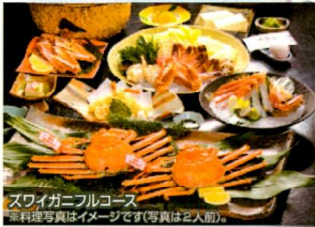
ズワイガニフルコース ※料理写真はイメージです(写真は2人前)